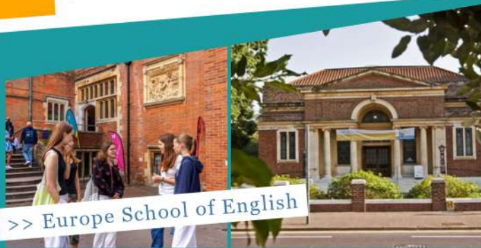
>> Europe School of English

Antes de la llegada al centro (vía online) o el primer día de clase, los estudiantes realizarán un test de nivel, el cual permitirá una asignación adecuada con alumnos que compartan su mismo nivel de inglés.